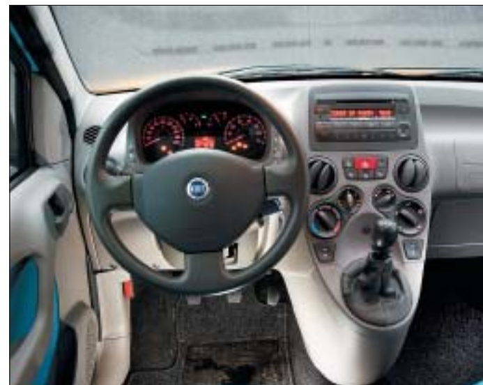
Instrumentbordet er spændende lavet med en stor midterkonsol med radio og varmearnlæg i fin højde. Gearstangen lige ved rattet betjenes let