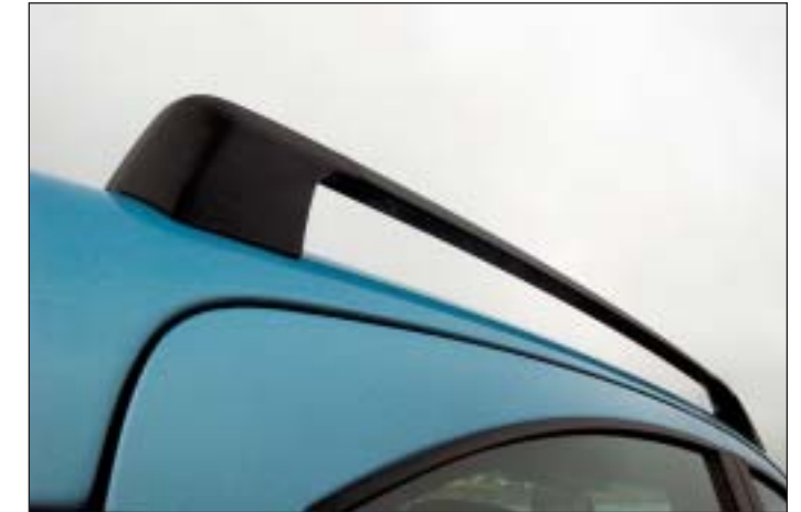
Tagbøjler er standard. De er velegnede til en tagboks – der godt kan være nødvendig. For selv om Panda er rummelig, er den trods alt kun en lille bybil