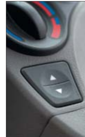
El-ruder i fordørene er standard, mens bagdørenes ruder betjenes med håndsving

et betragteligt. ESP til 4.000 kr. er også stærkt anbefalelsesværdigt. Dels modvirker systemet udskridningstendenser, dels indeholder det bremseassistent, tractioncontrol og en interessant lille ekstra finesse: Hill-holder, som automatisk modvirker, at bilen kører baglæns, når man skal sætte i gang på en bakke. En tredje sikkerhedssele til bagsædet er også en mulighed – den koster 700 kr. Lægger man alle disse elementer oven i grundprisen, lander man på godt 130.000 kr. Det ændrer billedet, så Panda med ét bliver en bil, der slår konkurrenterne på pris, sikkerhedsudstyr og indretning. Samlet set ville karakteren blive bedre end snittet.