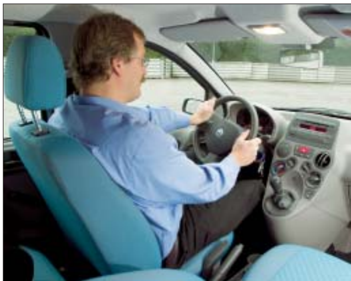
Panda er lille , og man sidder med skulderen mod dørstolpen. Rattet kan kun justeres i højden. Hovedstøtterne fortil er o.k.

bekymringer for, hvordan Panda vil klare sig i en trafikulykke. En crashtest i Euro NCAP-regi kan afklare en del af dette spørgsmål, men endnu er Panda ikke testet. Er man blevet bjergtaget af Panda, men er utilfreds med sikkerhedsniveauet, kan man selv gøre noget ved sagen. Fiat tilbyder en del sikkerhedsudstyr som fabriksmonteret udstyr mod merpris. Her finder vi bl.a. de livreddende airbaggardiner, som forkun 2.500 kr. hæver sikkerhedsniveau-