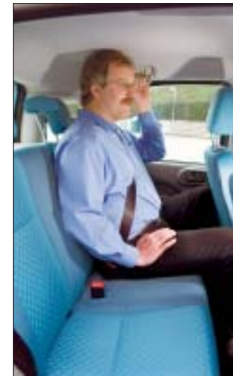
Fin loftshøjde bagtil, men begrænset benplads. For voksne er hovedstøtterne uden sikkerheds-værdi