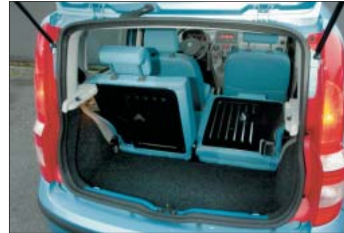
Som standard er bagsæderyglænet ikke delt, men for 3.000 kr. ekstra fås dette delte, nedfældelige bagsæde