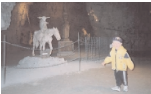
En tur under jorden i Tingbæk Kalkmine. Vi måtte have jakkerne frem, der var koldt dernede.