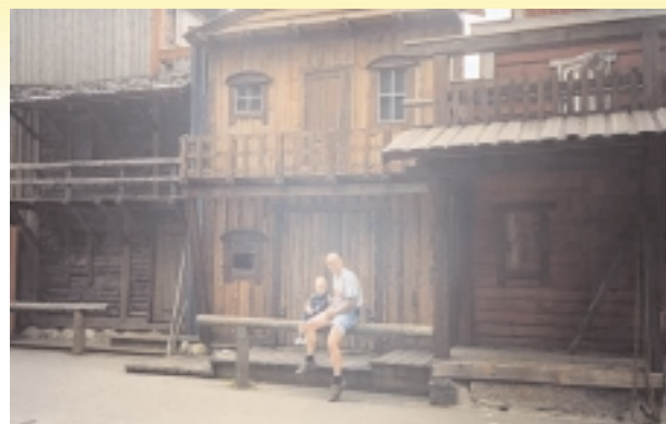
Hovedgaden i High Chapparral. Det er ikke billedet der er dårligt – så støvet var der!

Vi fik dog lov til at komme med toget alligevel. Og turen gik sådan set også meget godt. Lige til en bande outlaws stoppede og plyndrede toget for postsækkene. Det var et forrygende optrin med de gode, de onde og de grusomme. Det var vist de onde der vandt, så vidt vi lige kunne se. Et par