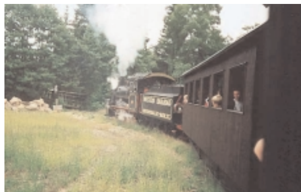
Vi kører langsomt fremad med damptoget. Vi ved endnu ikke at vi om et kort øjeblik bliver overfaldet.