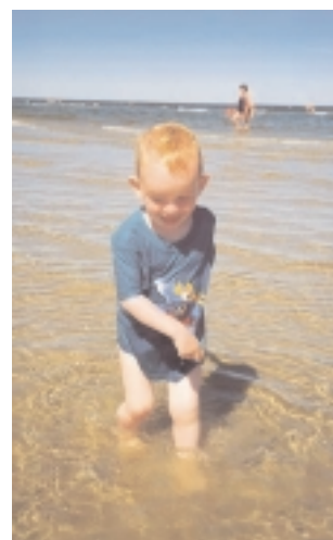
En vandhund giver da ikke op selv om han fryser.