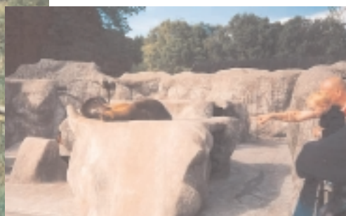
Der var i hvert tilfælde søløver på klipperne!