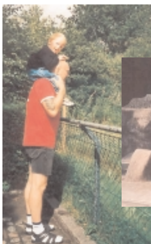
På udkik efter dyr i Aalborg Zoo – »Mon der overhoved er dyr inde i buskadset?«.