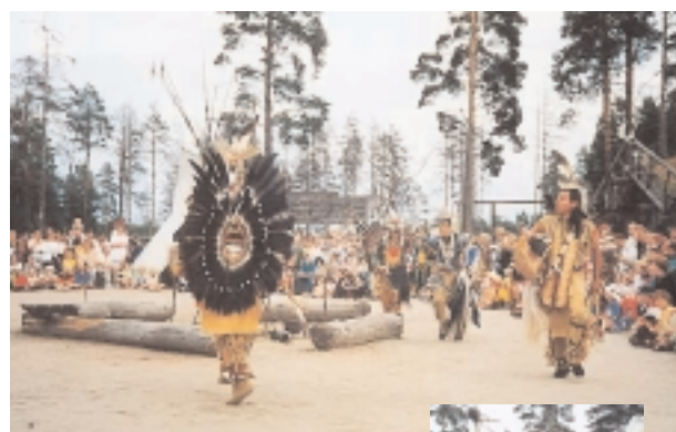
Den flotte opvisning over på indianer øen. Showet varede omkring tre kvarter.