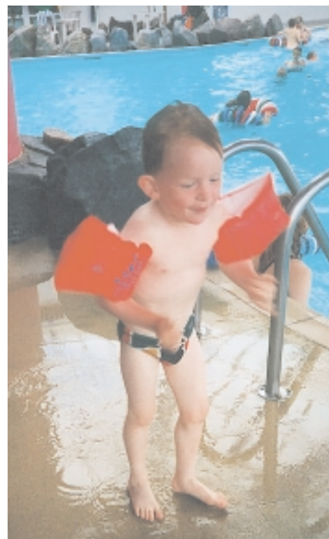
Vandland i Øster Hurup - "Uhhh, det er lidt koldt - men jeg vil prøve den store rutschebane igen!"