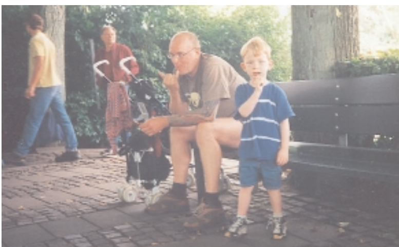
To trætte mænd efter en lang dag i zoo.