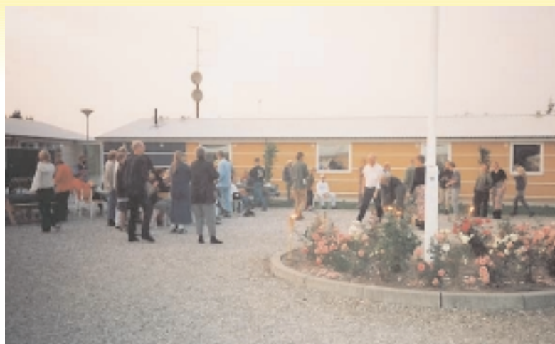
Fællesarealet midt i Sønderjyllands Idræts- og Naturefterskole.

sportslige aktiviteter for alle aldre på lejren - det er rigtig godt. Næste dag om eftermiddagen var der arrangeret en tur til Tøndermarsken og Højer Sluse. En lokal enhedslistemand (har glemt navnet) der vidste utroligt meget om området var guide. Det blev til en lang forblæst, men meget smuk tur rundt på digerne og inde i marsken. Vi havde dog regnet med at kunne køre med vores klapvogn på digerne - øh, det kan man altså ikke. Så Anders og klapvogn måtte bæres rundt. På turen tilbage til bussen så vi forresten en død halvrådden ræv - lærerigt syn.